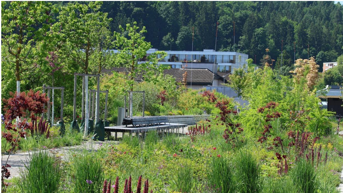
Abbildung 5: Ueberlandpark auf Überdachung