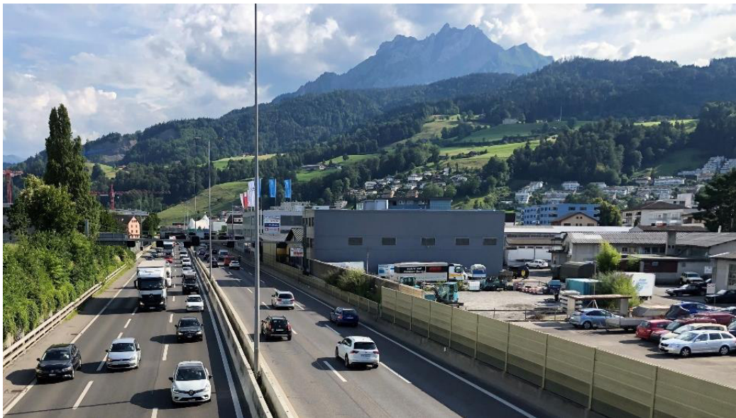
Abbildung 1: Heutiger Raum im Gebiet Luzern-Süd

Die Autobahn A2 im Raum Luzern-Süd wird bereits heute von durchschnittlich 70'000 Fahrzeugen pro Tag befahren. Zwischen dem Tunnel Sonnenberg und dem Tunnel Schlund verläuft die Autobahn offen durch das Siedlungsgebiet der Stadt Kriens. Mit neuen Siedlungsverbindungen über die Autobahn soll die Trennwirkung wesentlich verringert, die Siedlungsentwicklung nach innen ermöglicht und der Lärmschutz sowie die Störfallvorsorge verbessert werden.