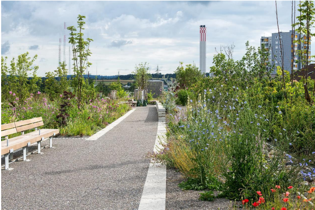
Abbildung 4: Ueberlandpark auf Überdachung