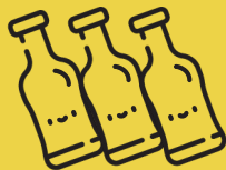
Altglas Nach Farben getrennt. Unklare Farben ins Grünglas